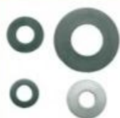
Molas Prato DIN - 680/681