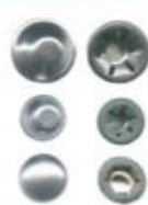
Acopladas de Retenção