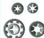
Discos de Fixação I75/I36