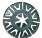
Defletor de Calor